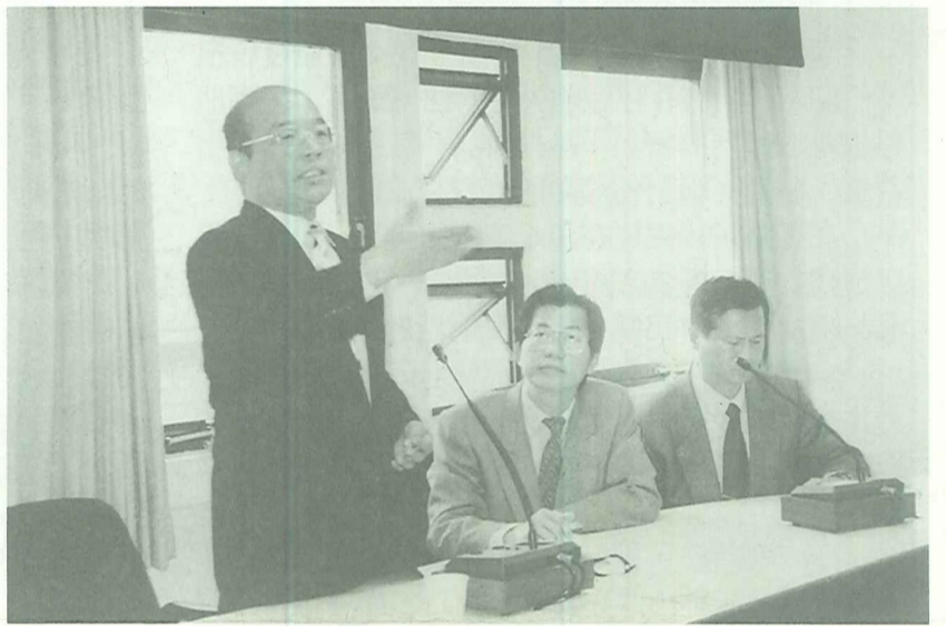
今年3月9日淡水文化基金會，協同立法委員李應元、淡水鎮長郭哲道及搶救淡水河行動聯盟等有關單位，向台北縣長蘇貞昌(左一)說明淡水河北側快速道路一案