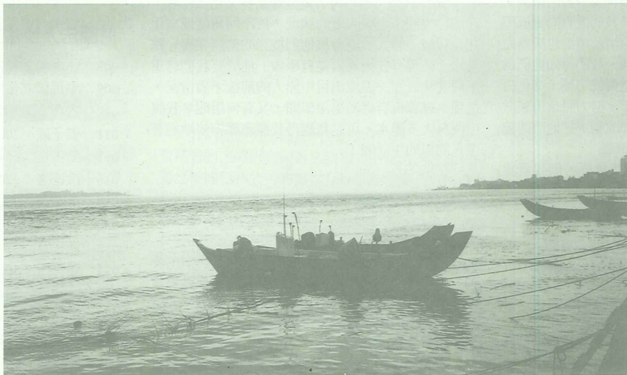
淡水河出海

無奈的是：交通部定案即興建的淡水環河快速道路，採填河造路方式來完成的。連同附屬設施，路基須侵犯河六十公尺以上。）政府一方面斥巨資建堤防、設抽水站、徵收土地修成疏洪道，卻一方面硬直行事，與大自然爭地、壅塞河口，相互矛盾的做法讓稅務人為之氣結。事關臺北盆地六百萬居民的生命財